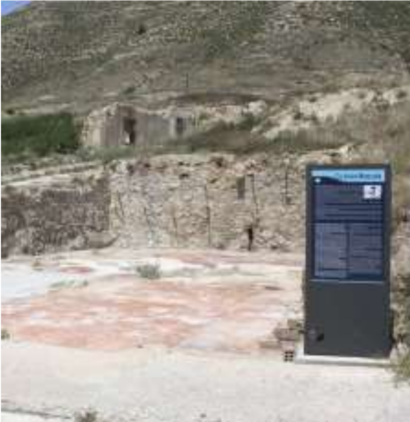
Restes de la casa de Jesús Moncada. Espai Museístic.